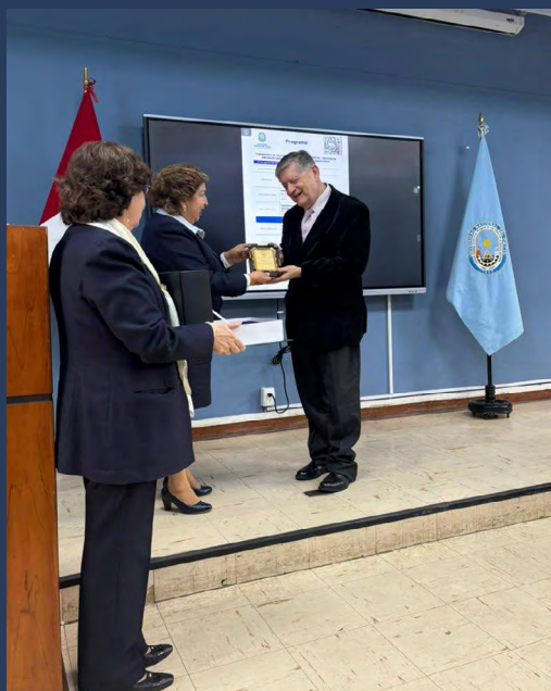
Universidad Nacional del Callao