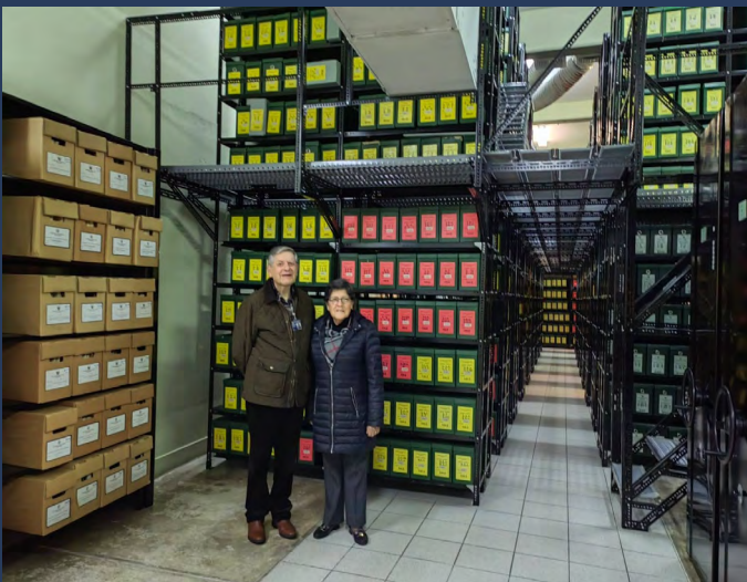
Archivo del Ministerio de Relaciones Exteriores

Finalmente, quisiera manifestar mis buenos deseos para el desarrollo de la archivística en el Perú, éxito a sus profesionales y que pronto llegue el anhelado día de contar con un edificio central para el AGN, tarea pendiente de larga data, pero en camino desde hace varias gestiones.